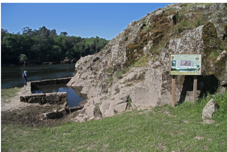
Fonte mineiromedicinal Augas de Sela