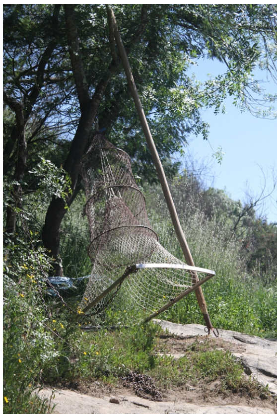
Viturón e gancho