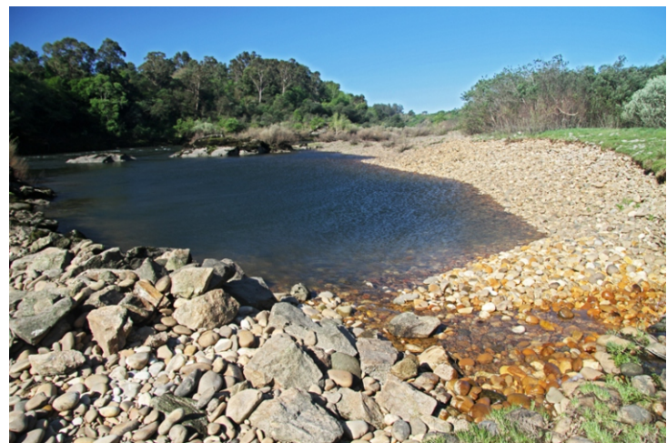
Raña en Sela