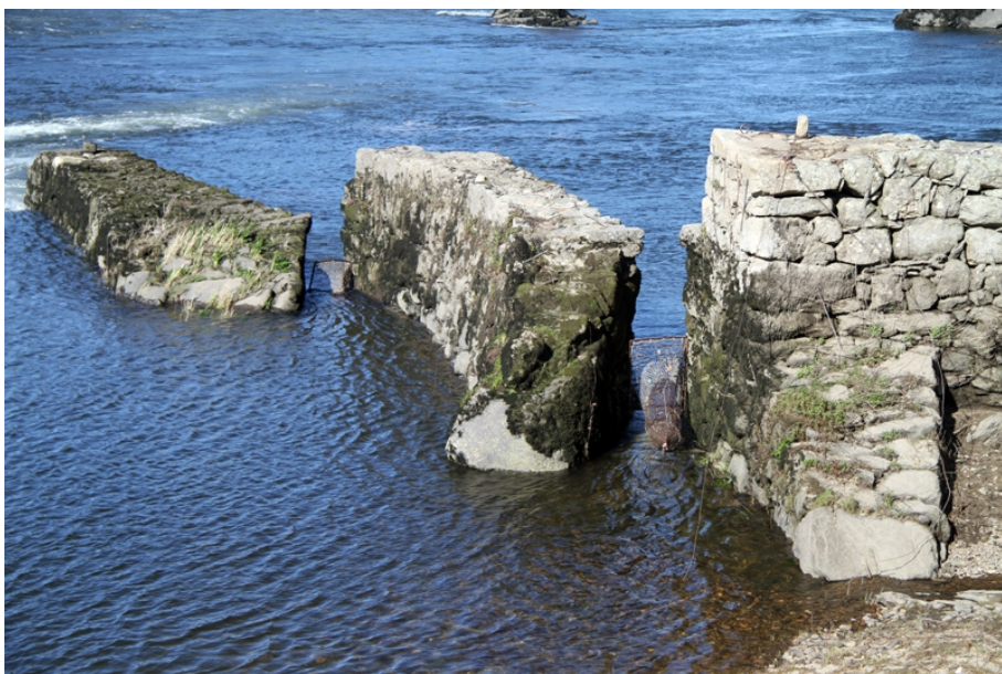
Pesqueira cos vituróns armados nos corredores entre os poios