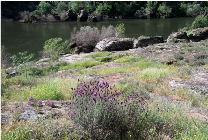
Arzaias á beira do Miño