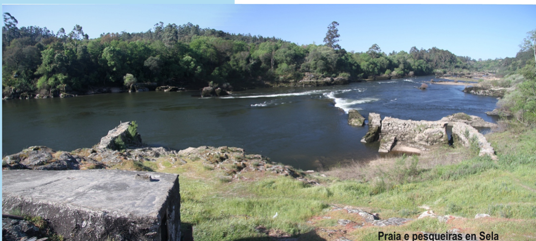
Praia e pesqueiras en Sela