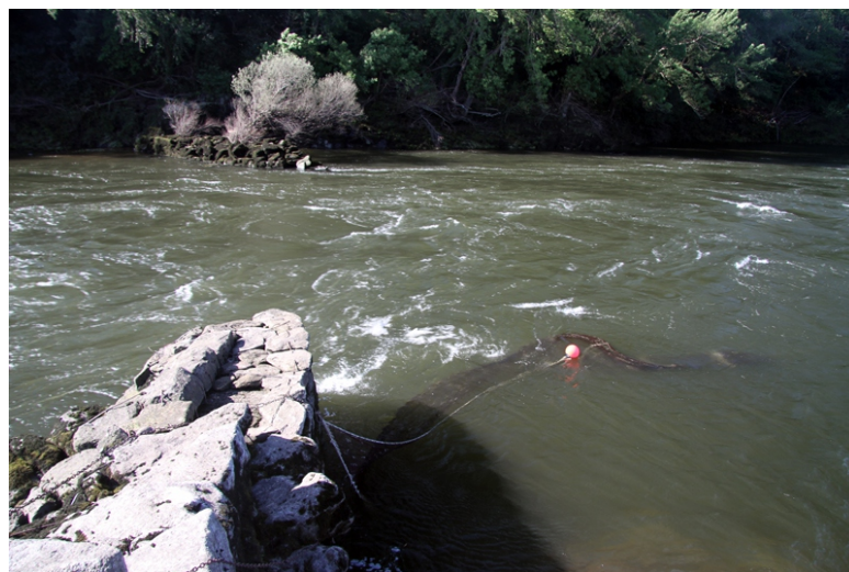
Rede cabaceira (tradicionalmente emprégabase unha cabaza como boia)