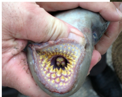
Boca dunha lamprea