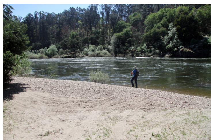
Praia na Barca de Loimil